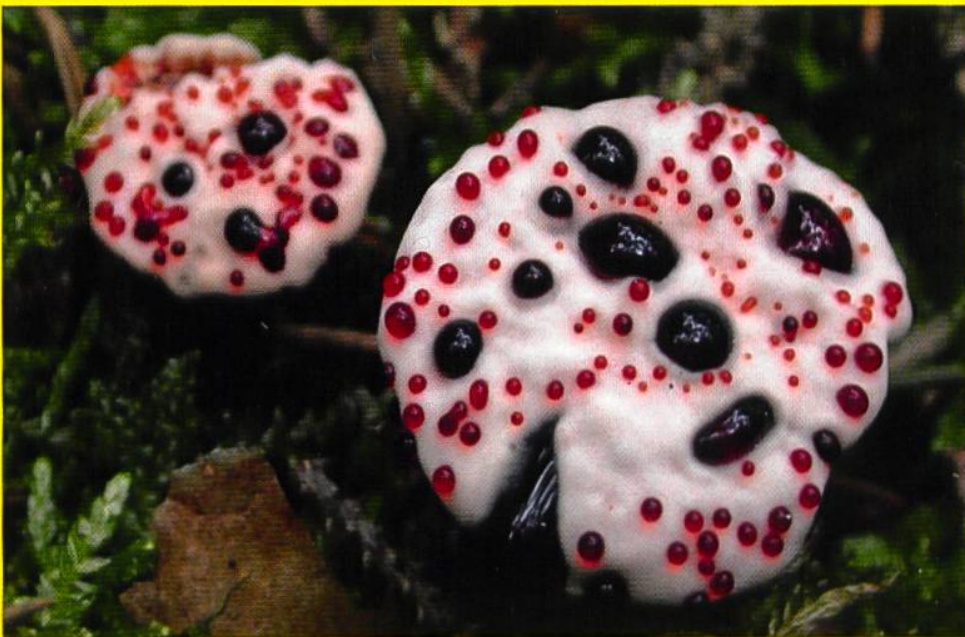
Scharfer Korkstacheling Hydnellum peckii

100 Jahre VSVP / 100 ans USSM / 100 anni USSM