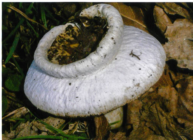
RUSSULA SP. (sopra) E CORTINARIUS SP. (sotto)