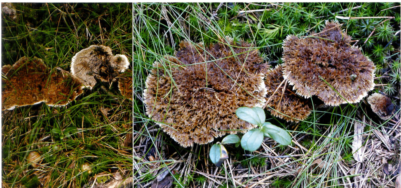
HYDNELLUM MIRABILE Fruchtkörper

Hyphen monomitisch, verzweigt, teils stark angeschwollen, Septen ohne Schnallen. Keine eigene Messung vorgenommen, nach Lit. 3–11 µm breit.