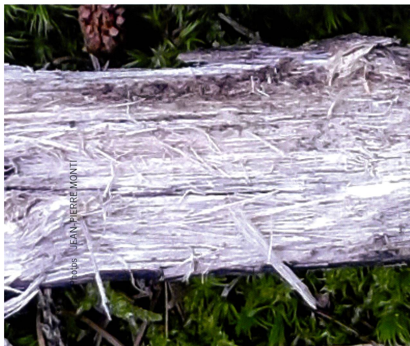
Fig. 5 Pourriture blanche | Abb. 5 Weissfäule