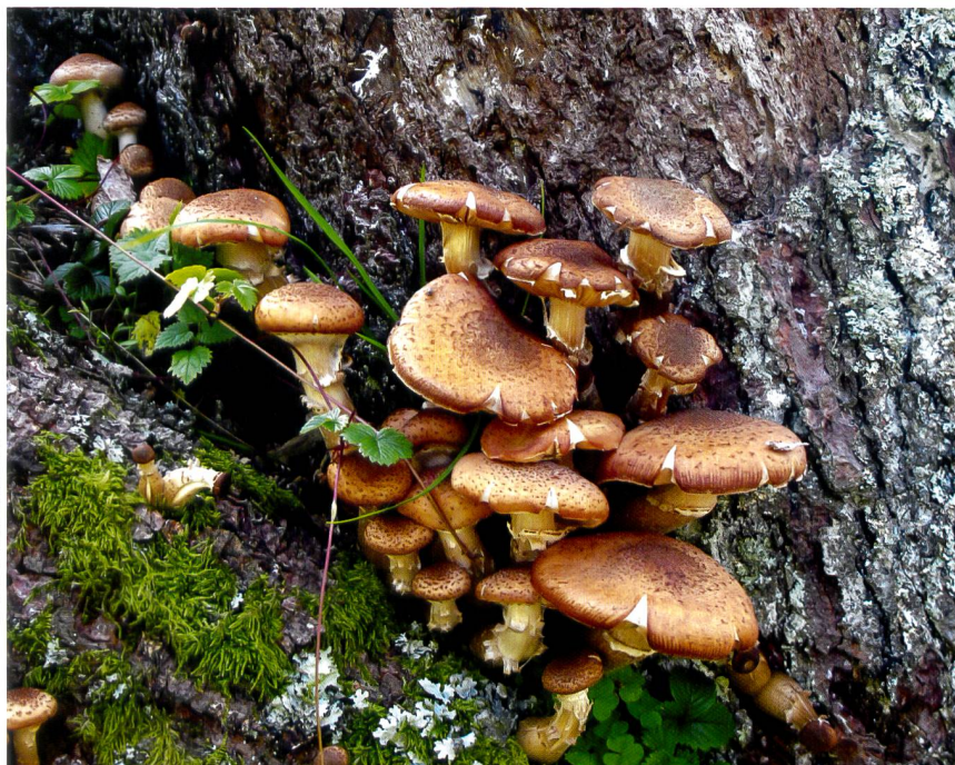
Fig. 7 Armillaria ostoyae , stade parasite Abb. 7 Armillaria ostoyae , parasitisches Stadium

Terminologie Vocabulaire spécifique à une activité humaine, qu'elle soit littéraire scientifique ou professionnelle.