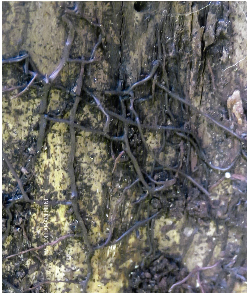
Abb. 8 Rhizomorphen von Armillaria ostoyae , saprophytisches Stadium Fig. 8 Cordons mycéliens d' Armillaria ostoyae , stade saprophyte