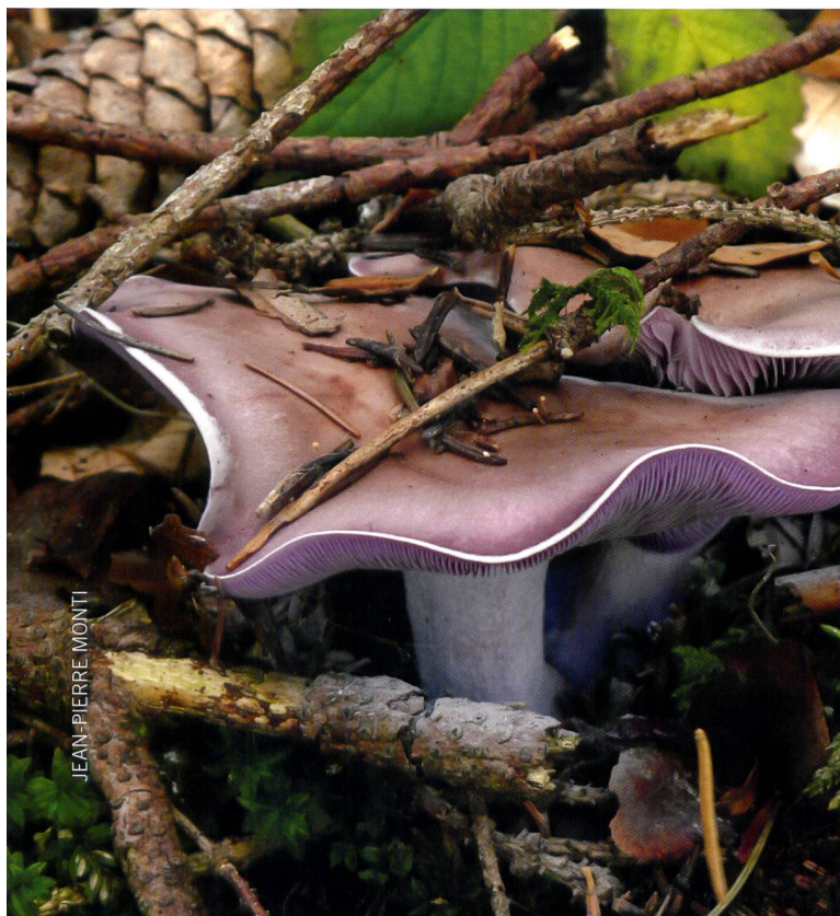
Fig. 3 | Abb. 3 Lepista nuda

Sans les champignons saprophytes, les déchets organiques s'accumuleraient sur le sol et formeraient des couches toujours plus épaisses contenant une