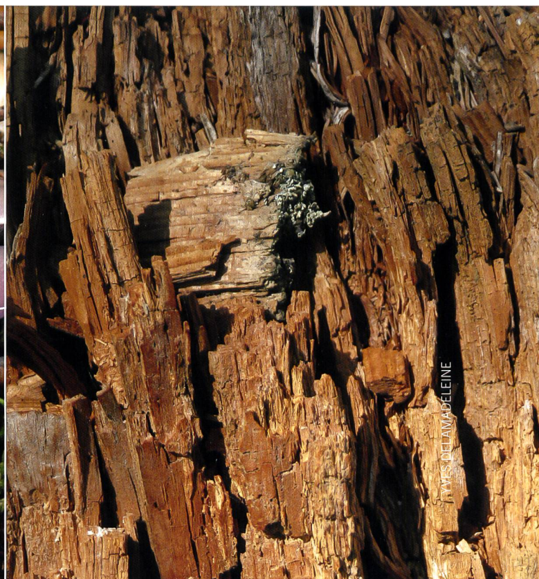
Fig. 4 Pourriture cubique | Abb. 4 Braunfäule