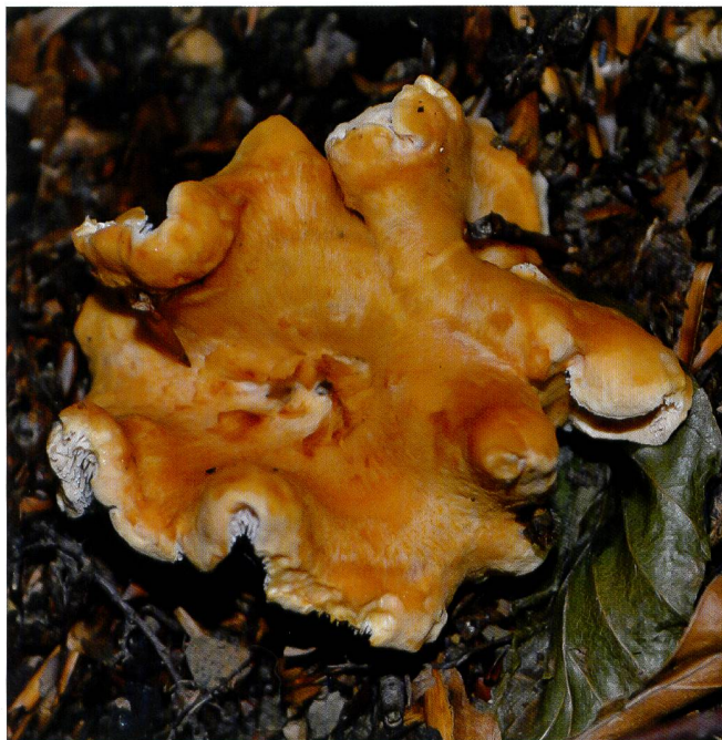
HYDNUM ELLIPSPORUM Fruchtkörper am Standort im Val Muggio | Fructification sur sa station de la vallée de Muggio

FRIEBES G. 2013. Zum derzeitigen Kenntnisstand der Stoppelpilze ( Hydnum ) in Europa. Tintling 2013 (5): 53–57.