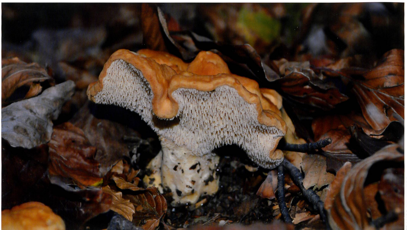
HYDNUM ELLIPSO SPORUM Fruchtkörper am Standort im Val Muggio | Fructification sur sa station de la vallée de Muggio

Für die molekulargenetische Untersuchung wurde DNA je aus einem Stachel des Hymeniums eines der Tessiner Fruchtkörper und eines als H. cf. ellipso sporum bestimmten Fundes aus Winterthur ZH mit Hilfe eines käuflichen DNA-Extraktions-Kit extrahiert. Mit den Primern ITS1F und ITS4 in einer Standard PCR die ITS1-5.8-ITS2-Region der ribosoma-