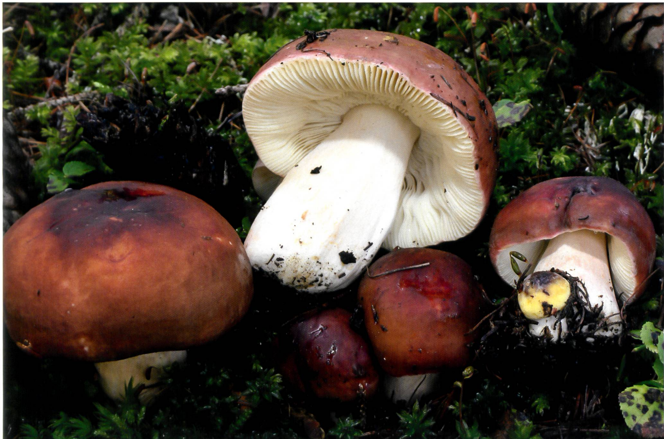
RUSSULA FAVREI Fruchtkörper | Fructification

Stiel 30–60 x 15–25 mm, zylindrisch bis keulig, zuerst markig voll, später schwammig weich und manchmal hohl. Oberfläche: längsaderig, cremefarben bis hellockerlich, stellenweise bis ganz