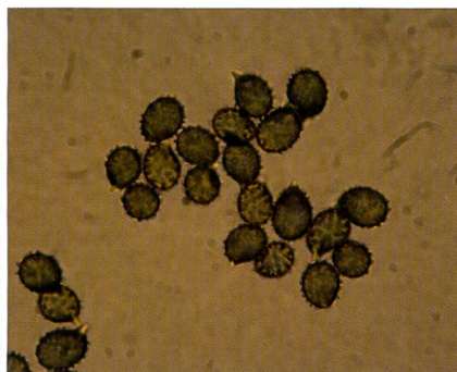
RUSSULA FAVREI Sporen in Melzer | Spores dans le Melzer

Il m'est possible de désigner un partenaire mycorhizien sans équivoque. Les mélèzes et les épicéas ont poussé dans la proximité immédiate de chaque station. Sur l'alpage moussu de Törvel VS, j'ai récolté également R. favrei dans des forêts de pins et de mélèzes à presque 2000 m d'altitude.