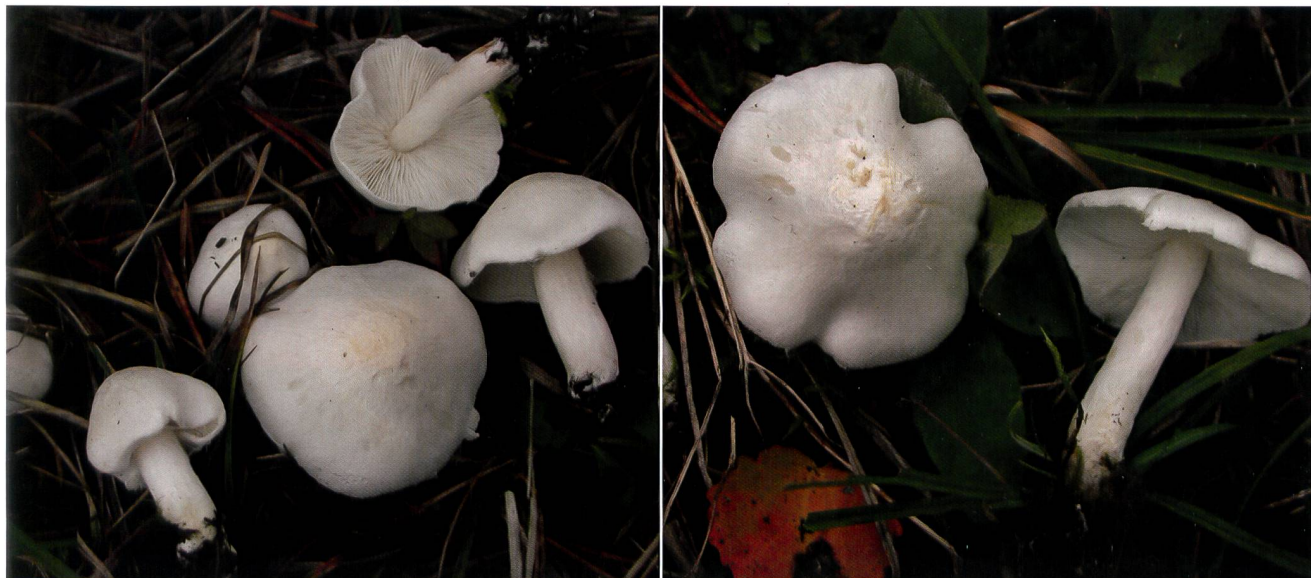
TRICHOLOMA ALBIDUM Weisser Erdritterling