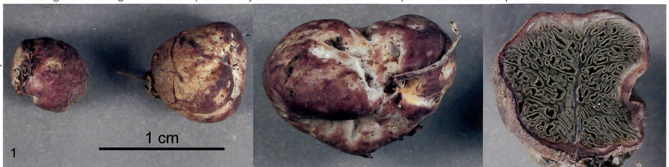
Fig 1 HYSTERANGIUM CORIACEUM Hesse, carpophores récoltés par M. H. Fluri. La coupe longitudinale montre la gléba gélatineuse et ses cavités irrégulières. Les lignes claires font partie de l'hyménium formé de basides. La «queue» est un rhizomorphe.

Abb. 1 HYSTERANGIUM CORIACEUM Hesse, von Herrn Hans Fluri gesammelte Fruchtkörper. Das längs aufgeschnittene Exemplar zeigt die unregelmässig gekammerte, gelatinöse Gleba. Die hellen Linien sind das Basidien-Hymenium. Der «Schwanz», der diesem Pilz zu seinem deutschen Namen verhalf, ist eine Rhizomorphe.