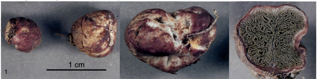
Fig 1 HYSTERANGIUM CORIACEUM Hesse, carpophores récoltés par M. H. Fluri. La coupe longitudinale montre la gléba gélatineuse et ses cavités irrégulières. Les lignes claires font partie de l'hyménium formé de basides. La «queue» est un rhizomorphe.

Abb. 1 HYSTERANGIUM CORIACEUM Hesse, von Herrn Hans Fluri gesammelte Fruchtkörper. Das längs aufgeschnittene Exemplar zeigt die unregelmässig gekammerte, gelatinöse Gleba. Die hellen Linien sind das Basidien-Hymenium. Der «Schwanz», der diesem Pilz zu seinem deutschen Namen verhalf, ist eine Rhizomorphe.