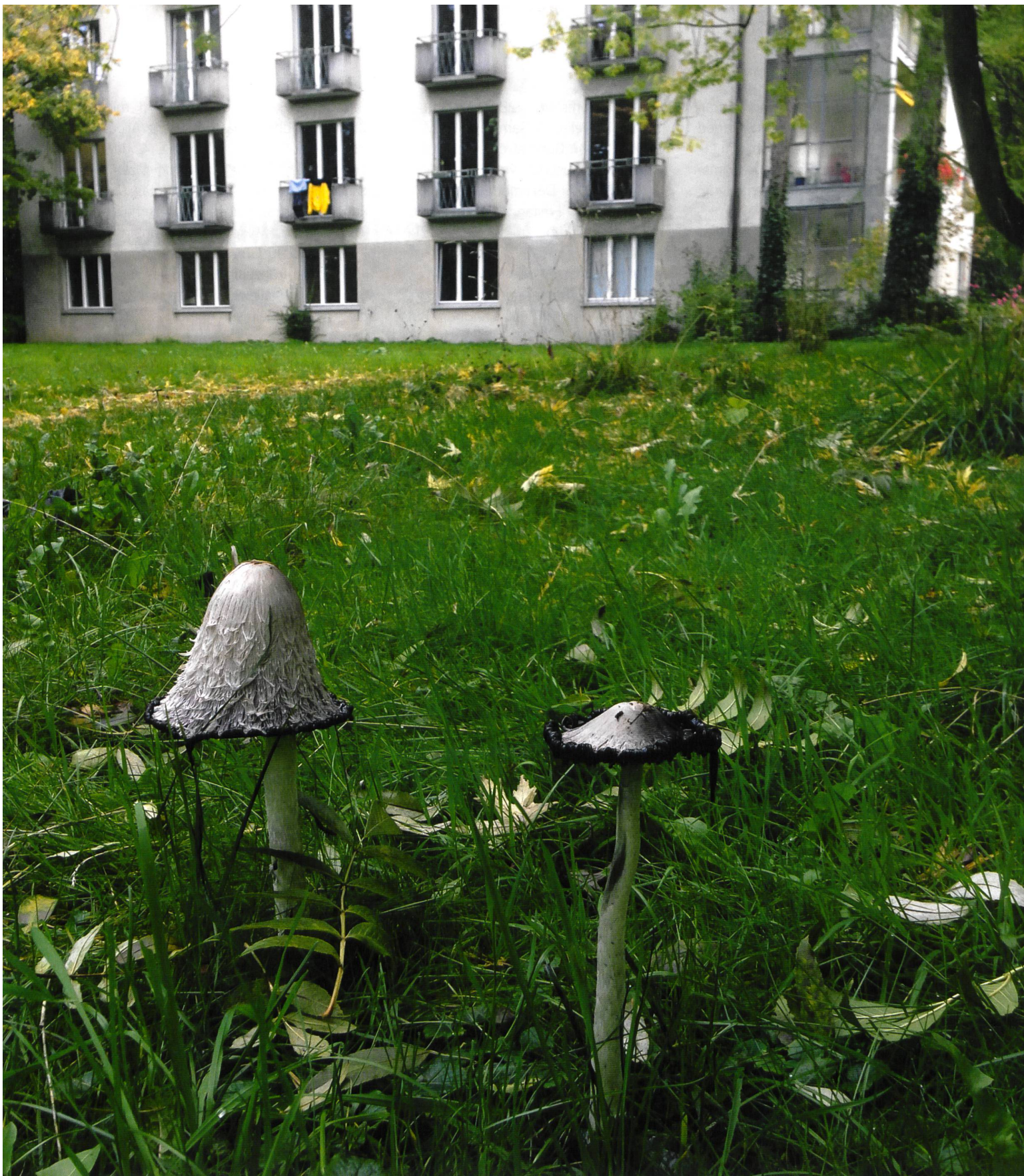
Schopftintlinge ( Coprinus comatus ) auf dem Areal des Berner Inselspitals. Le Coprin chevelu ( Coprinus comatus ) dans les jardins de l'Hôpital Universitaire de Berne.