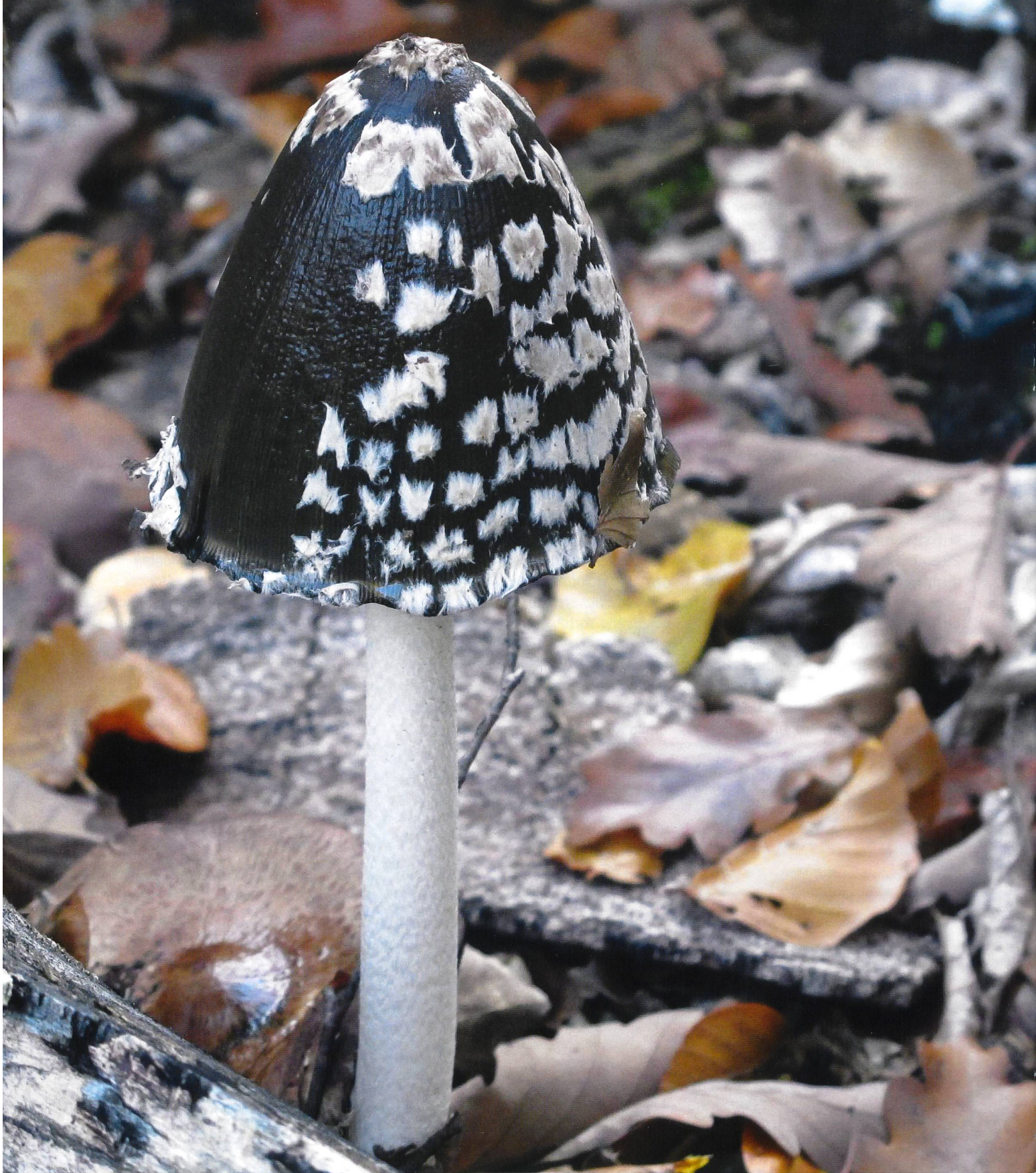
Specht-Tintling ( Coprinus picaceus ). Le Coprin pie ( Coprinus picaceus ).