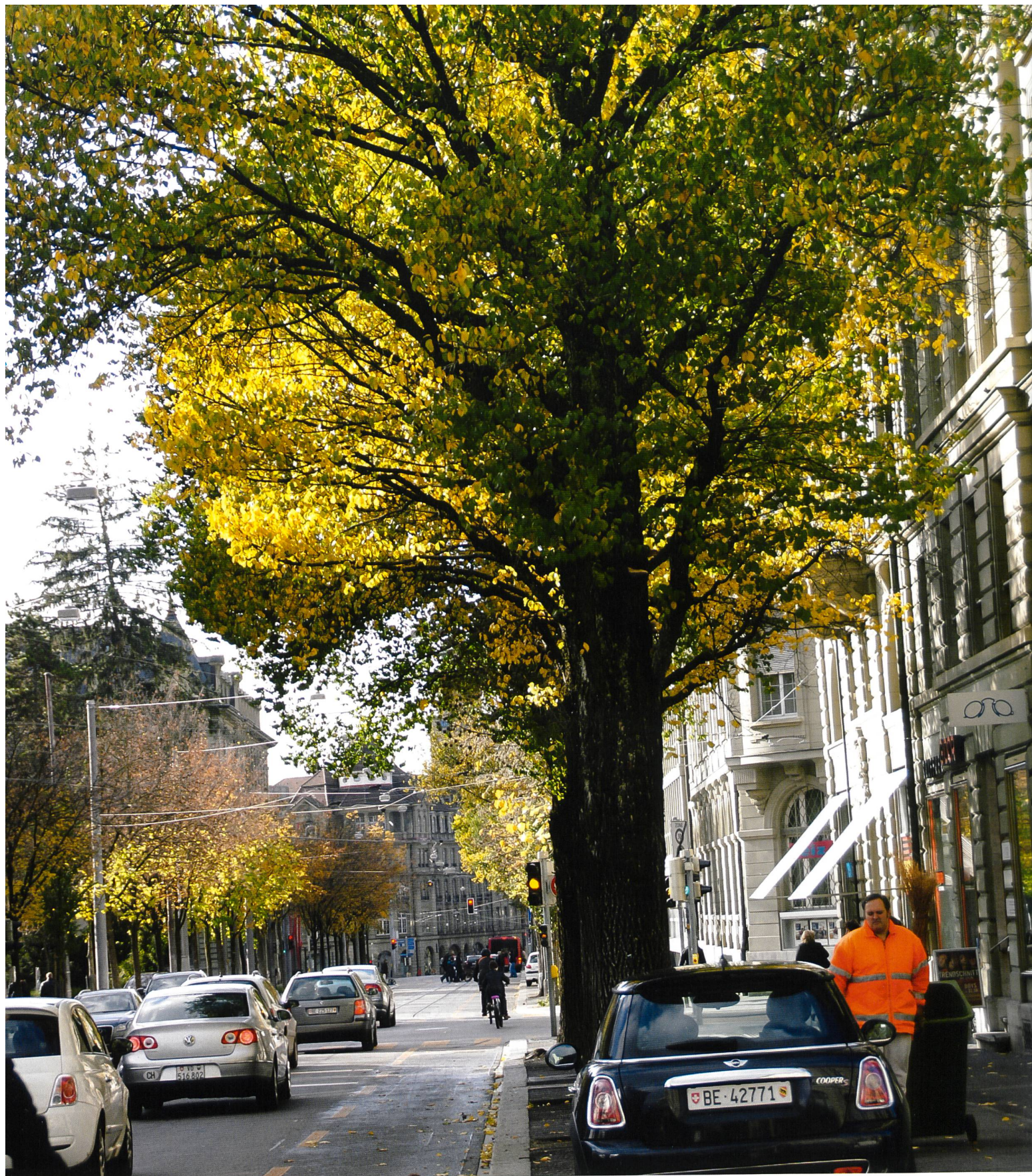
Der Standort des Ulmenraslings (siehe Titelbild) an der Bundesgasse in Bern. Un orme à la Bundesgasse à Berne, l'habitat de Hypsizygus ulmarius (voir page de garde).