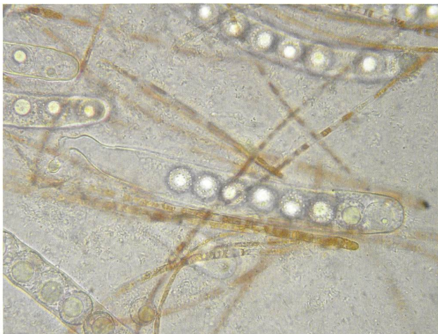
LAMPROSPORA LUTZIANA Asci | Asques