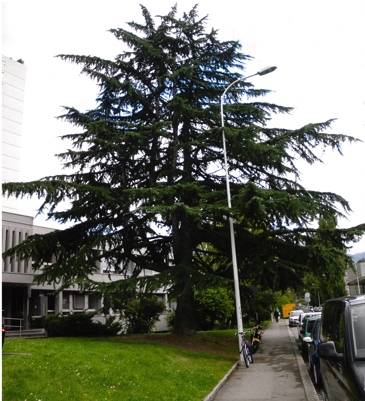
Eine Atlaszeder ( Cedrus atlantica ) in der Stadt Genf, potenzieller Standort des Zedernbecherlings (siehe Titelseite). Un cèdre de l'Atlas ( Cedrus atlantica ) à Genève, l'habitat de Geopora summeriana (voir page de garde.)