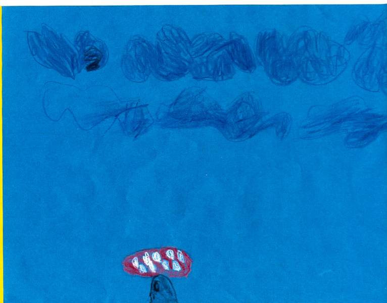
Fliegenpilze aus Sicht von Kinderaugen... Des amanites tue-mouche vues par les enfants...