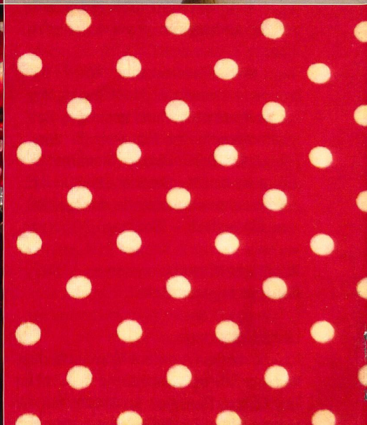
Fliegenpilze in zig Varianten... Des variations d'amanites tue-mouche...