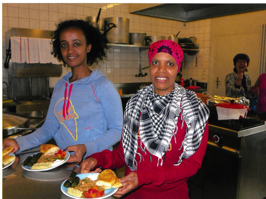
MITGLIEDER DER VEREINIGUNG AGORA BEIM ZUBEREITEN DES AUSGEZEICHNETEN MITTAGESSENS I MEMBRES DE L'ASSOCIATION AGORA PRÉPARANT LE REPAS DE L'AD.

Das Budget 2013 (mit einem kleinen Gewinn) wurde einstimmig bewilligt.