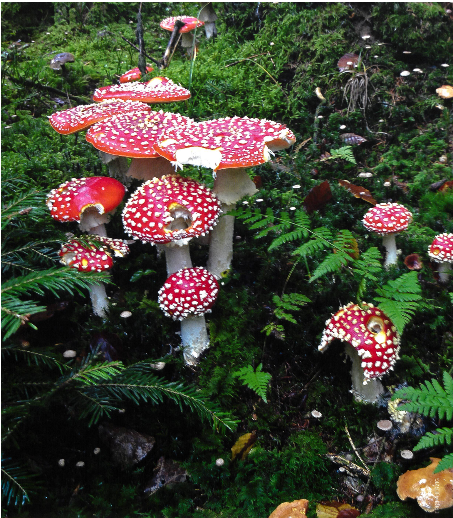
Eine Gruppe Fliegenpilze ( Amanita muscaria ). Un groupe d'Amanite tue-mouches ( Amanita muscaria ).