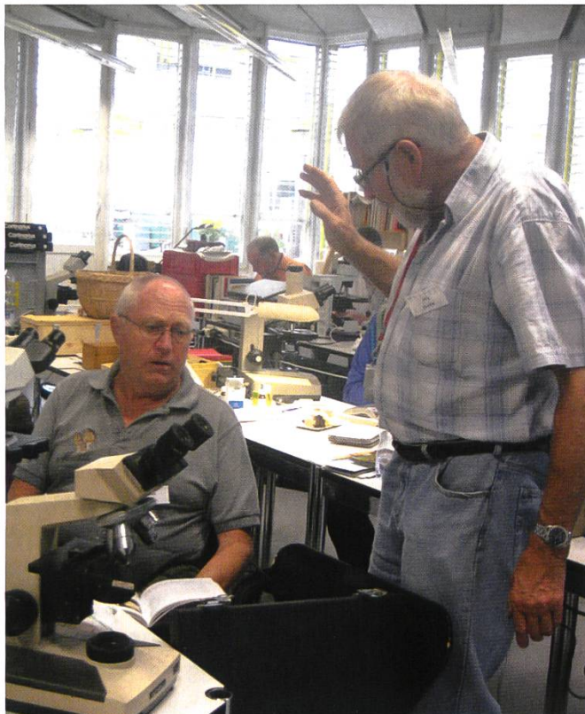
WK-Mitglieder an der Arbeit in Tramelan