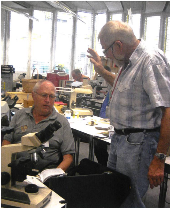
WK-Mitglieder an der Arbeit in Tramelan