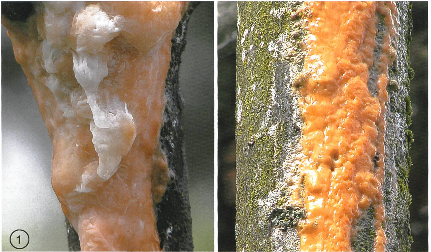
Die Pionnotes Konidienform eines Ascomyceten aus der Familie der Nectriaceen ist ein Schleim. Auf einem Strauch einer exotischen Cornus -Art in einem Garten in St. Sulpice bei Lausanne. Der Stamm rechts ist etwa armdick.