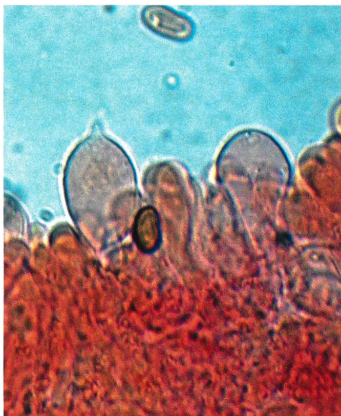
Psathyrella obscurotristis Cheilocistidi | Cheilozystiden | cheilocystides