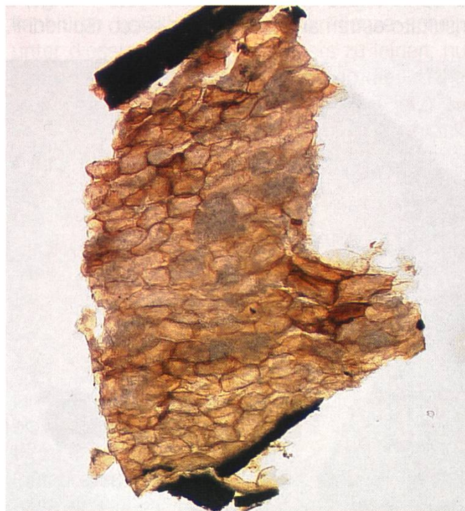
Ciborinia camelliae Sezione dello sclerozio | Schnitt durch ein Sklerotium unter dem Lichtmikroskop