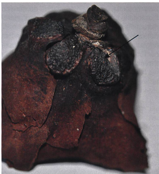
Ciborinia camelliae Fiore di camelia con sclerozi (freccia) | Kamelienblüte mit Sklerotien (Pfeil)

Il ciclo biologico comincia con la germinazione di una spora su un petalo e successiva penetrazione nel tessuto dell'ospite. Il petalo comincia a chiaz-