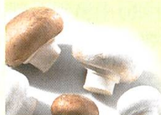
Champignon de Paris