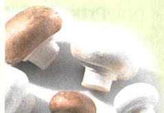
Champignon de Paris