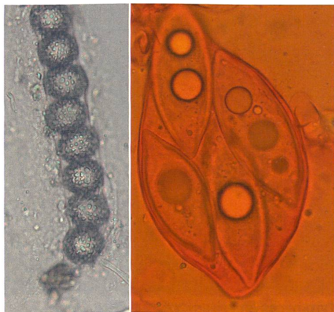
Genea verrucosa und Picoa carthusiana : Sporen.