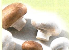
Champignon de Paris