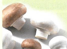
Champignon de Paris