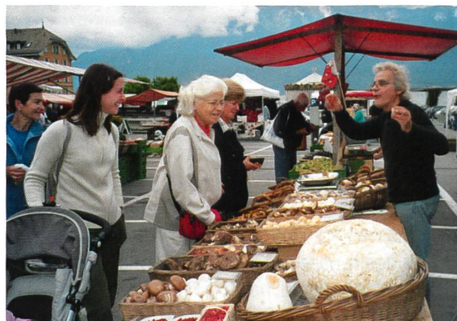
Marché à Vevey

pignons qui soit capable de concentrer le molybdène*. On en trouve aussi des teneurs très élevées dans le clathre en réseau ( Clathrus ruber ) et dans d'autres représentants de l'Ordre des Phallales. Le métal fait partie des enzymes qui produisent les mauvaises odeurs pendant le développement de ces champignons.