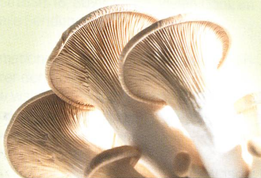
Kräuterseitling ( Pleurotus eryngii )