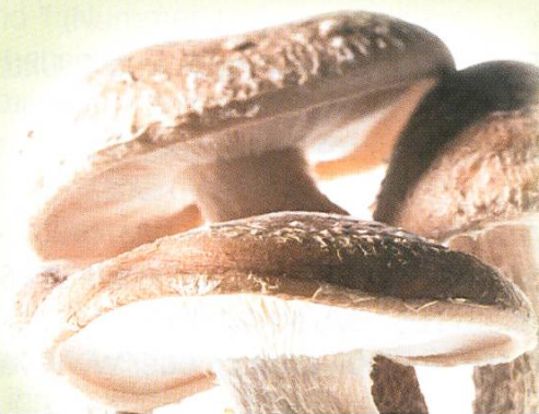
Shiitake ( Lentinula Edodes )