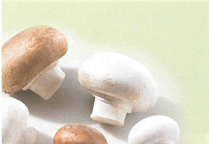
Champignon de Paris ( Agaricus bisporus )