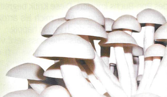
Shimeji/Buchenpilz ( Hypsizygus tessulatus )

Schweizer Pilze – täglich frisch auf Ihrem Tisch