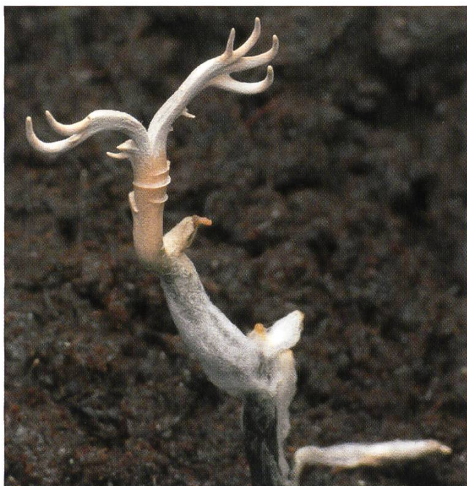
Xylaria escharoidea : Conidiophore | Konidienträger

Dans la halle Masoala du zoo de Zurich, il existe quelques termitières avec des espèces de termites du genre Heterothermes que je guette du coin de l'œil, tout spécialement à cause de ce problème de production de champignons. Au début de l'année 2008, un nid de termites s'est décroché de son support, probablement à cause de son poids. En période hivernale, l'humidité de la halle est vraiment élevée. Immédiatement, le sol fut recouvert d'un réseau de filaments semblable à un tapis, sans aucun doute, nous avons là un mycélium de champignon. On pouvait déjà apercevoir ici ou là, quelques fructifications à l'état de primordium. Par ces températures et par ces taux d'humidité très élevés, tout va bien plus vite que sous nos climats et malheureusement, je ne pouvais pas rester sans cesse sur ce lieu pour tout pouvoir observer. Je décidai alors de prendre, dans ces conditions, un fragment de couvain de termites chez moi, à la maison. Dans un terrarium, à l'aide d'une marmite stérilisée et d'une plaque chauffante, j'ai tenté de