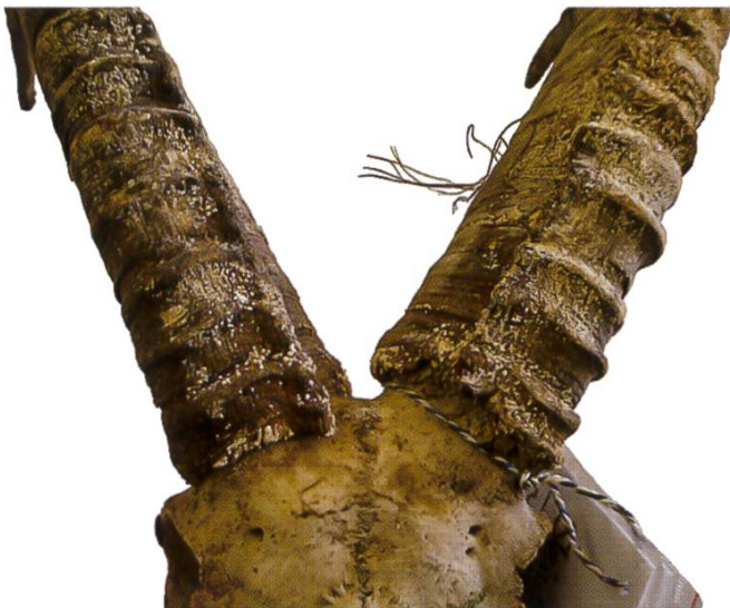
Fig. 1 Steinbockgehörn mit Pilzbewuchs

Allerdings zeigt ein Blick in die Nomenklaturdatenbank Index fungorum ( http://www.indexfungorum.org/Names/Names.asp ), dass noch zwei weitere Onygena -Arten beschrieben worden sind, die in Frage kommen könnten: Onygena arietina , beschrieben von einem Widdergehörn in Davos mit sehr dunklen Farben, und Onygena caprina mit zitronenförmigen Sporen (vgl. Tabelle 1).