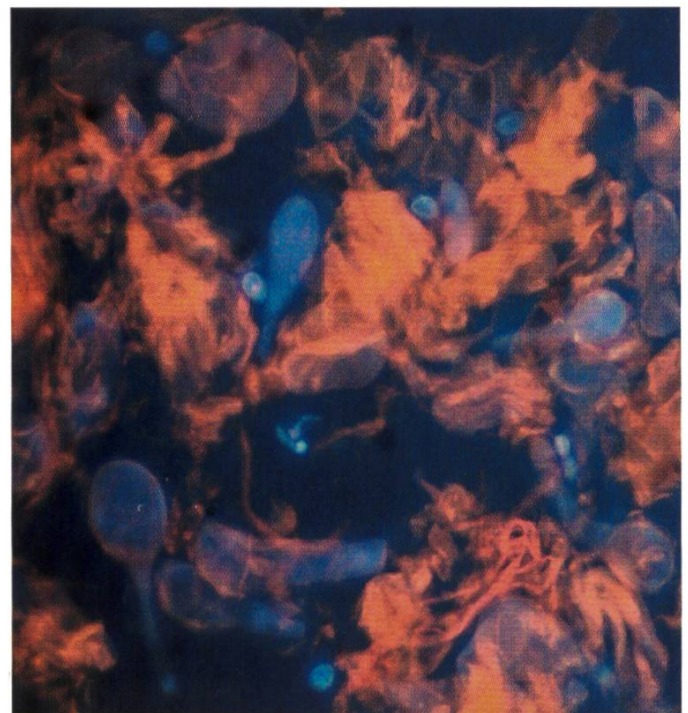
Foto 4 Amanita proxima Velum parziale