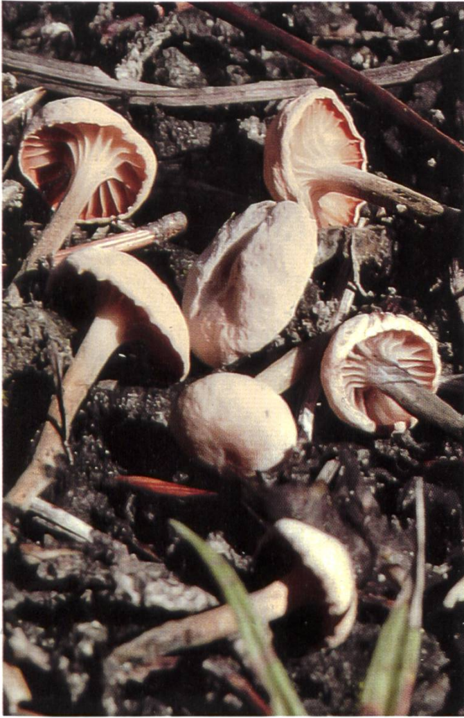
M. tricolor am Standort | dans son environnement var. graminis

förmigen, dickwandigen, im untern Teil braunen Hyphenenden und mehr oder weniger deutlich differenzierten Kaulozystiden. Diese ziemlich vielgestaltig von zylindrisch bis schwach keulenförmig mit Einschnürungen und kurzen fingerförmigen Auswüchsen (Ramealis-Struktur) im unteren Teil, dickwandig und teilweise olivschwärzlich.