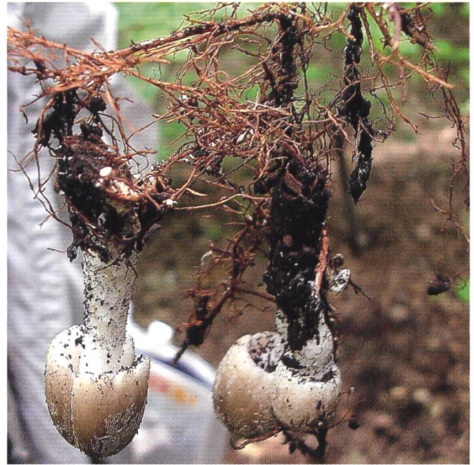
Rete di rizomorfe

Cheilocistidi > 35-80 \times 18-30 \mu\text{m} , numerosi e molto variabili nella forma, lageniformi, ventricosi, subfusiformi con apice digitato o irregolarmente forcato, utriformi fino a claviformi, con membrana molto esigua facilmente collassate.