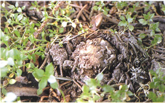
photo 1 Geopora cooperi f. cooperi