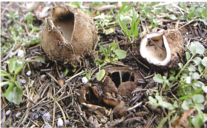
photo 3 Geopora sumneriana