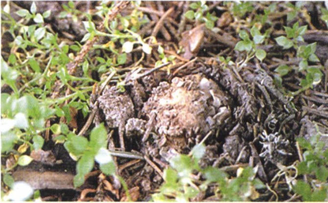
photo 1 Geopora cooperi f. cooperi