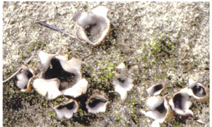
photo 4 Geopora arenicola