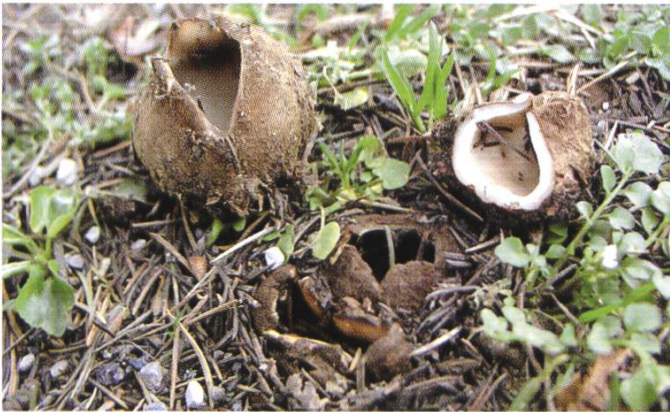
photo 3 Geopora sumneriana