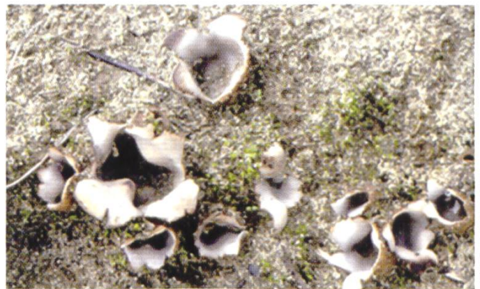
photo 4 Geopora arenicola