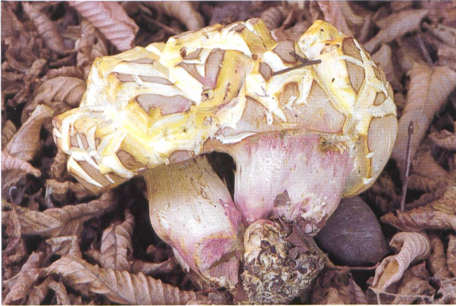
Schöngefärbter Röhrling, Boletus pulchrotinctus .