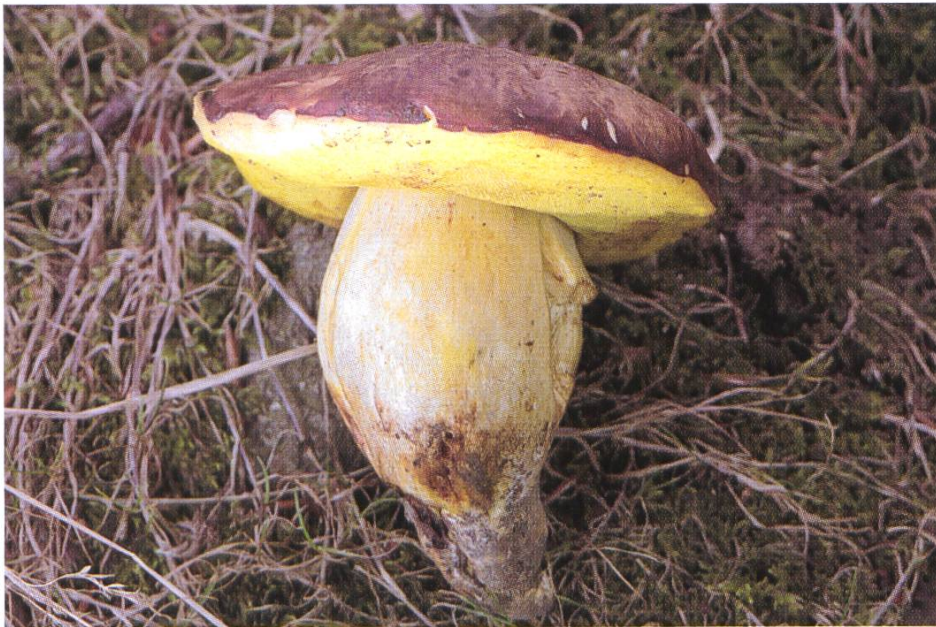
Gefleckthütiger oder Blasshütiger Röhrling, Boletus depilatus .