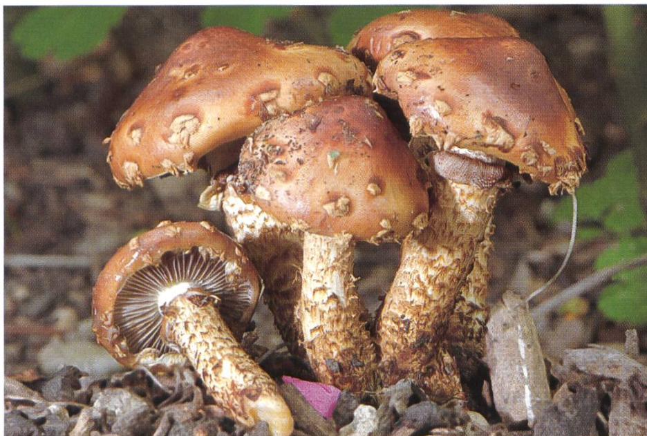
Weissgezählter Treuschling, Stropharia albocrenulata .