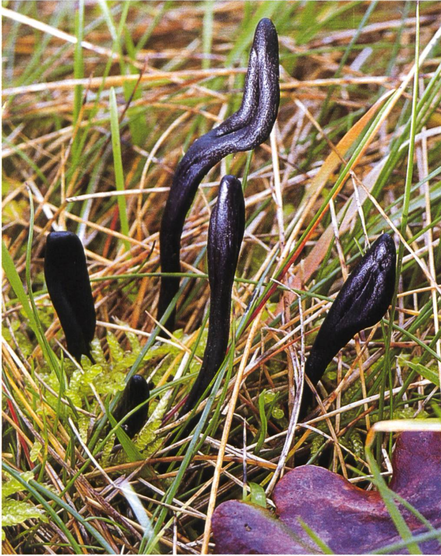
Geoglossum fallax , Täuschende Erdzunge