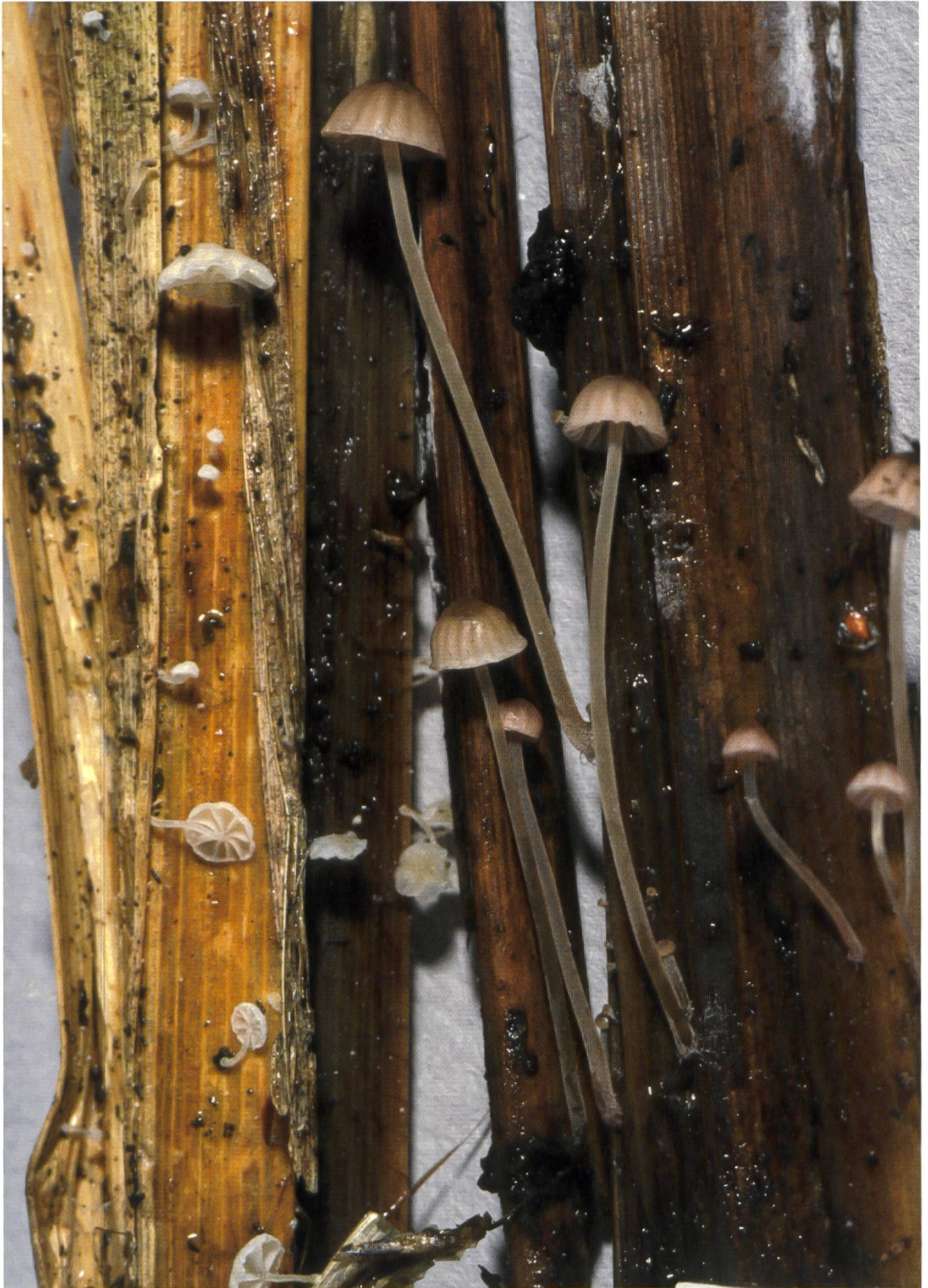
Mycena saccharifera (weisse Exemplare links) und Mycena tubarioides (rechts). Mycena saccharifera (de couleur blanche, à gauche) et Mycena tubarioides (à droite).