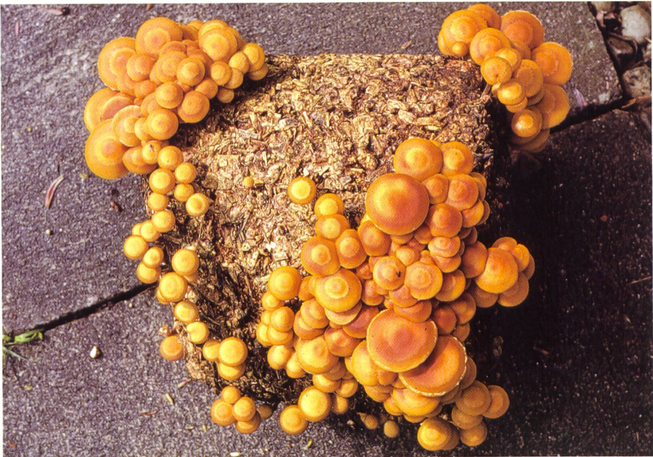
Pholiota nameko , Japanisches Stockschwämmchen / Pholiote japonaise