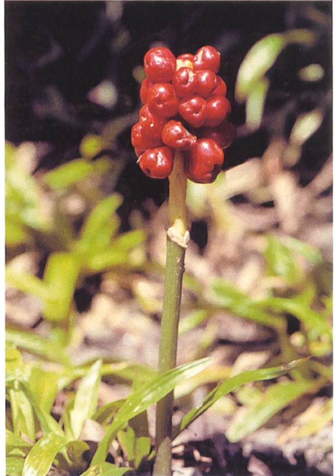
Abb. 5: Arum maculatum : Fruchtstand mit beerenartigen Früchten.