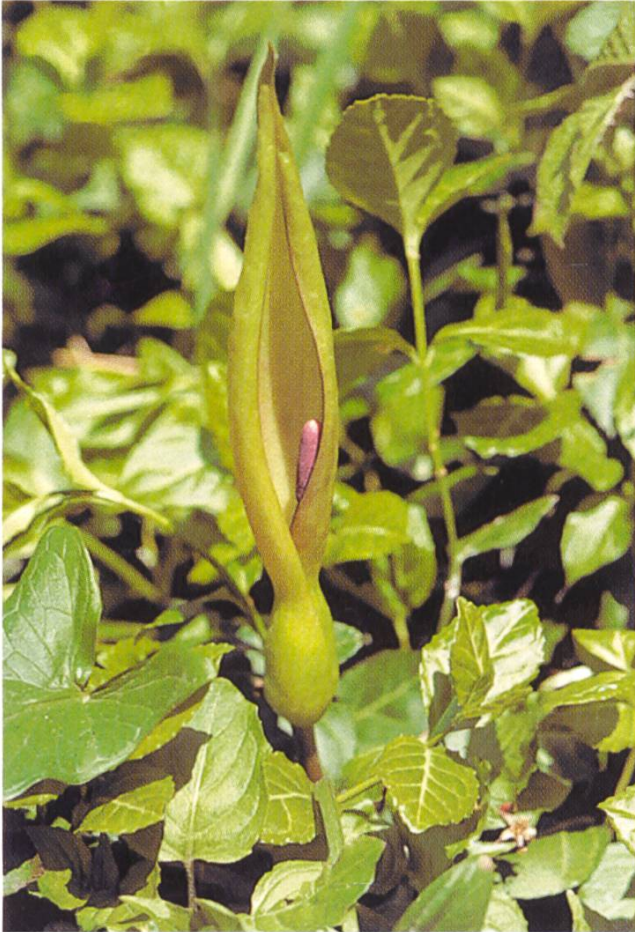
Abb. 4: Arum maculatum : Blütenstand mit Kolben, umhüllt von einem bunt gefärbten Hochblatt, der Spatha.