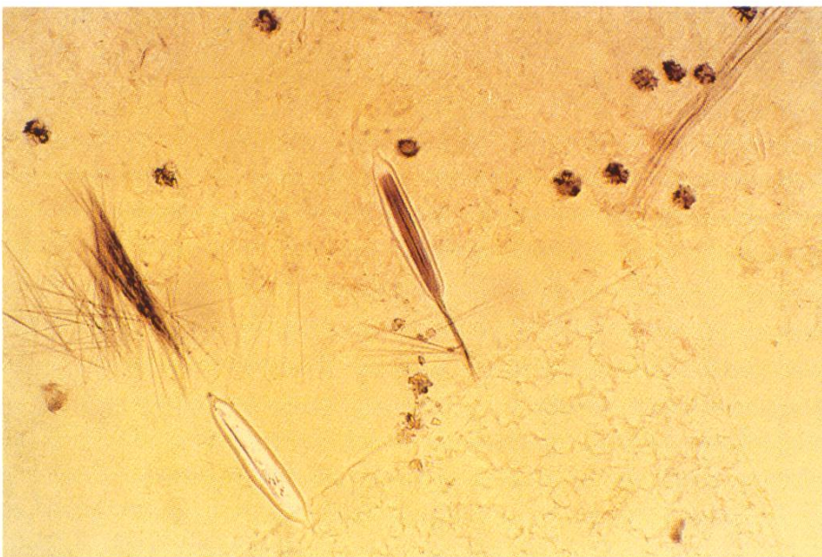
Abb. 3: Dieffenbachia sp. Intakter Idioblast (Schiess- zelle) in Bildmitte. Explodierte Schiesszelle links unten mit wirrem Raphidenbündel. Vergrößerung x 100.