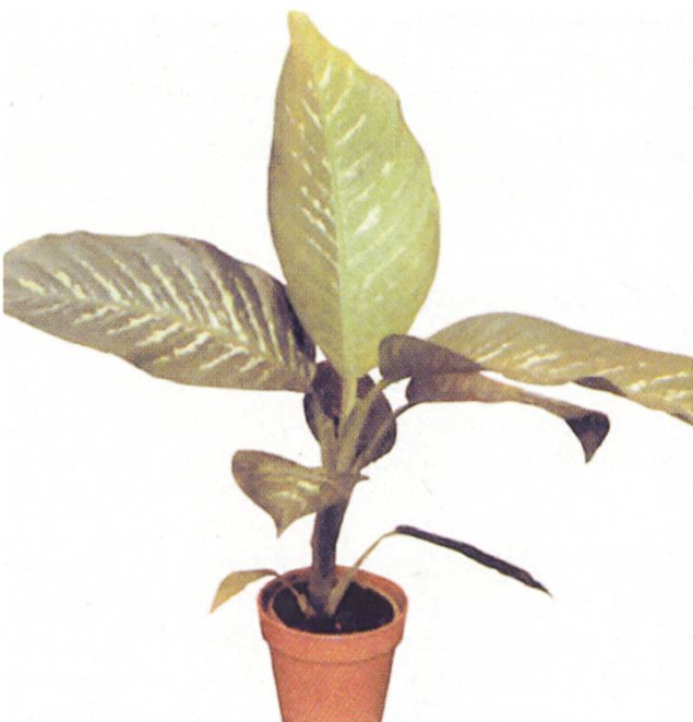
Abb. 6. / Fig. 6.