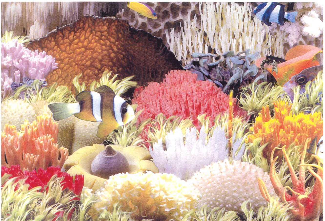
Fungi undersea (Postkarte / Carte postale)