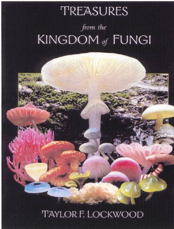
Buchumschlag / Couverture du livre