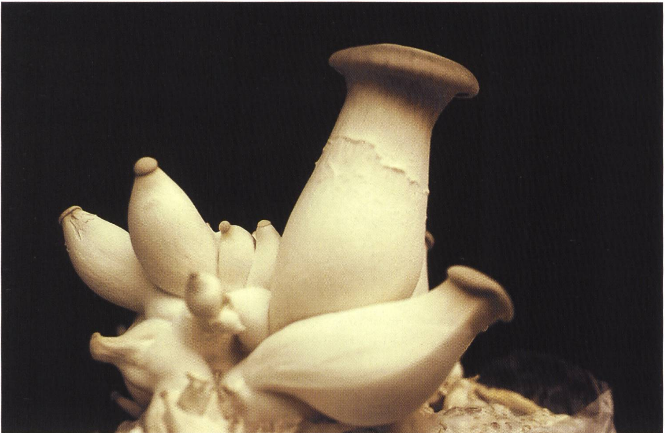
Pleurotus eryngii , Kräuterseitling