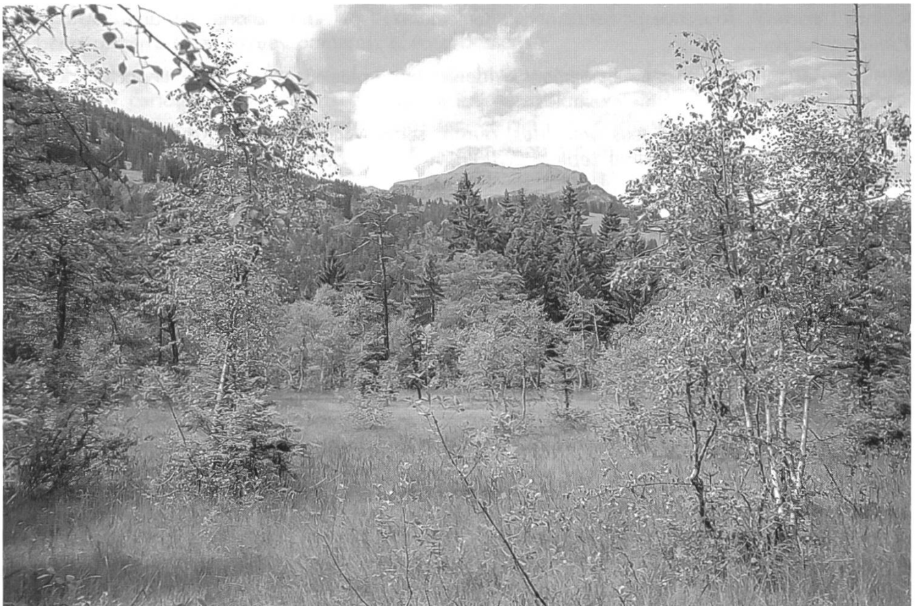
Habitat Geoglossum glabrum