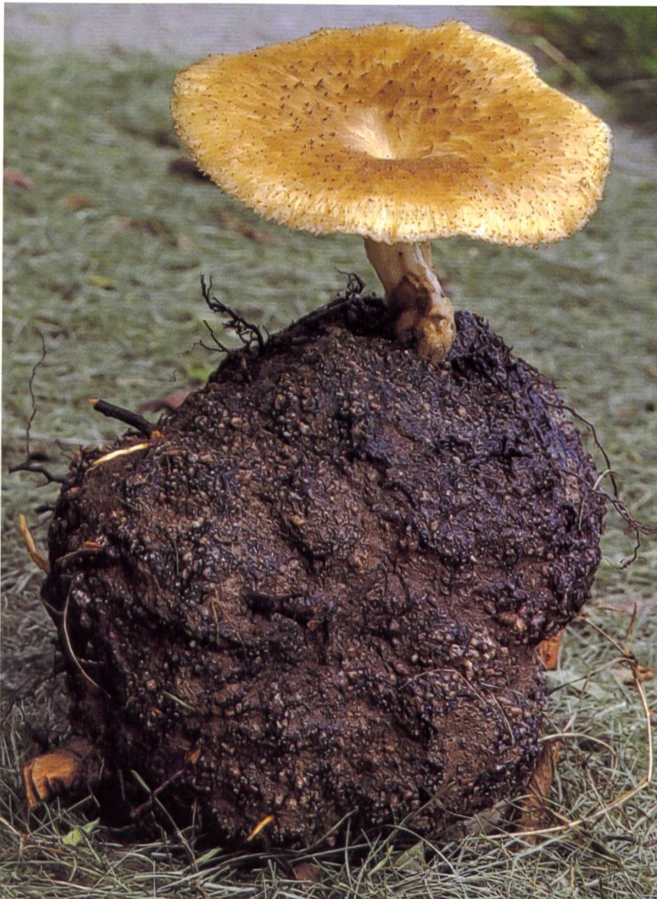
Polyporus tuberaster , Sklerotien-Porling. Polypore à sclérote.