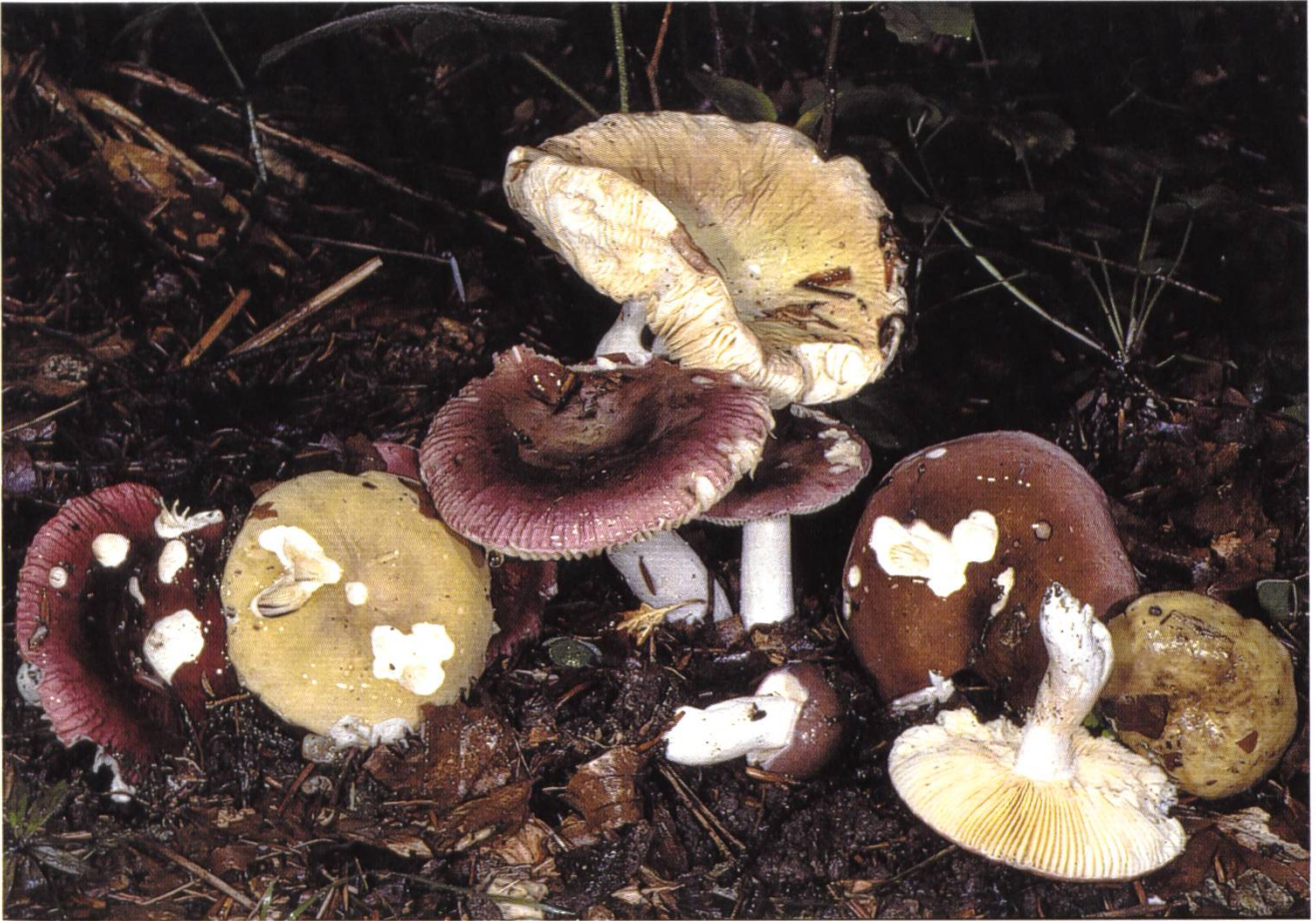
Russula amethystina Quélet