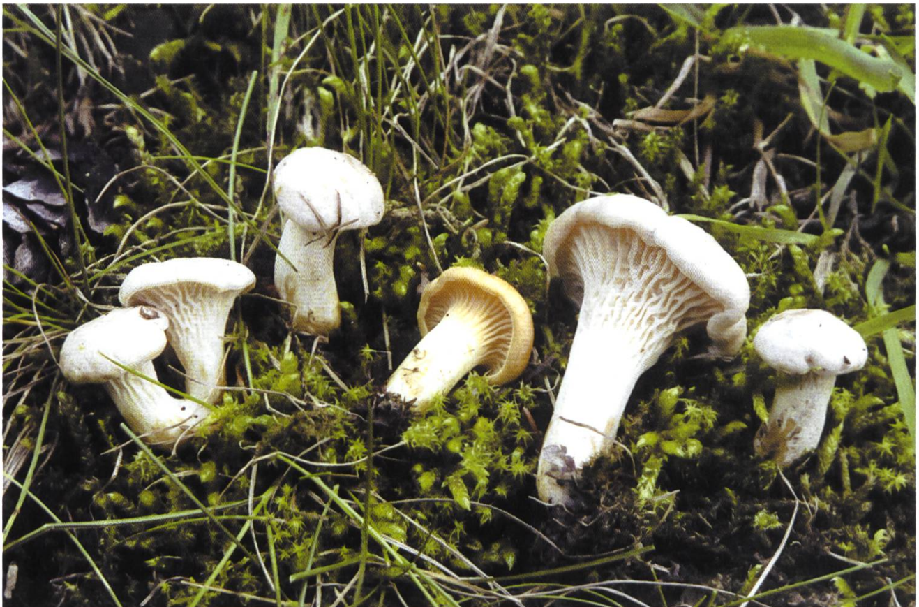
Weisse Pfifferlinge, die inmitten von gelben wuchsen. Sie zeigen rötlichbraune Druckstellen und stark queraderig verbundene Leisten.

In der Literatur, die ich besitze, gibt es noch eine Art C. pallens Pilát, die aber immer ein deutlich gelbes Hymenium aufweist, und eine C. pallidus R. Sch., die meistens nur als Varietät