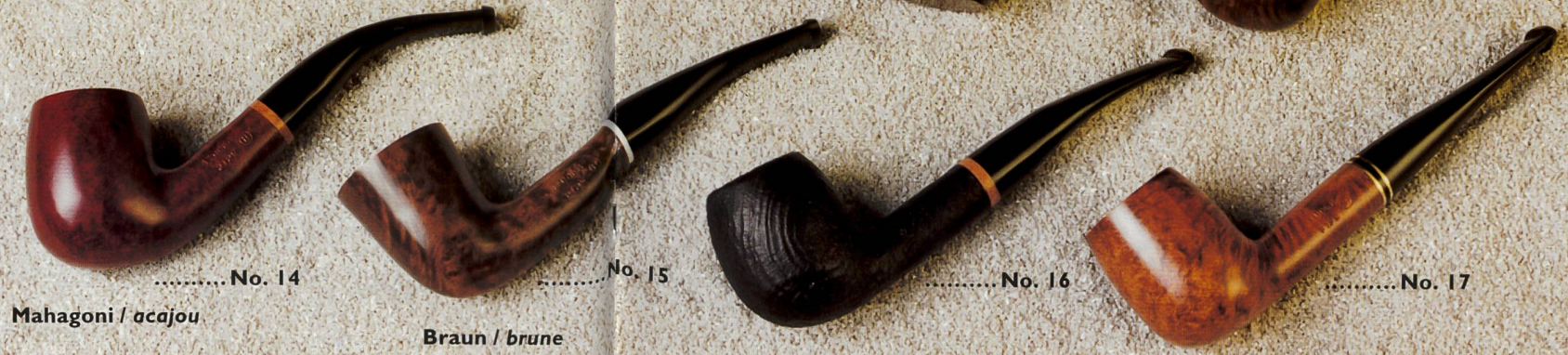
Mahagoni / acajou