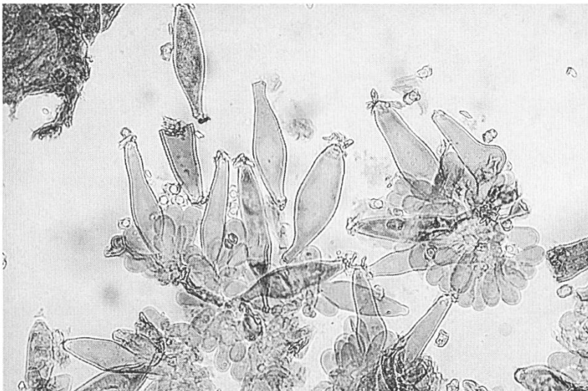
Cheilocistidi Cheilozystiden Cheilozystides