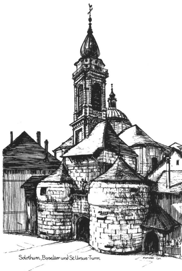
Solothurn, Baseltor und St. Ursen-Turm

1989 organisierte unser Verein die Schweizerische Pilzbestimmertagung in Riedholz. Dieser Anlass wurde in jeder Beziehung ein voller Erfolg, und wir hoffen, dass die Teilnehmer der Delegiertenversammlung 1992 ebenfalls positive Eindrücke mit nach Hause nehmen können.