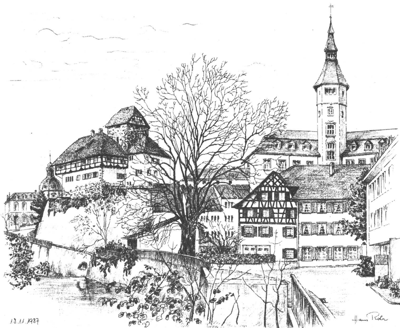
Schloss Frauenfeld/Le château de Frauenfeld

HERZLICH WILLKOMMEN IN FRAUENFELD, DER HAUPTSTADT DES KANTONS THURGAU VEREIN FÜR PILZKUNDE THURGAU