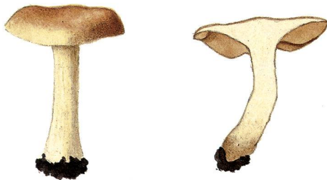
Hebeloma alpinum Bruchet (= H. crustuliniforme var. alpinum J. Favre)

Conservatoire botanique de Genève: Collection Jules Favre