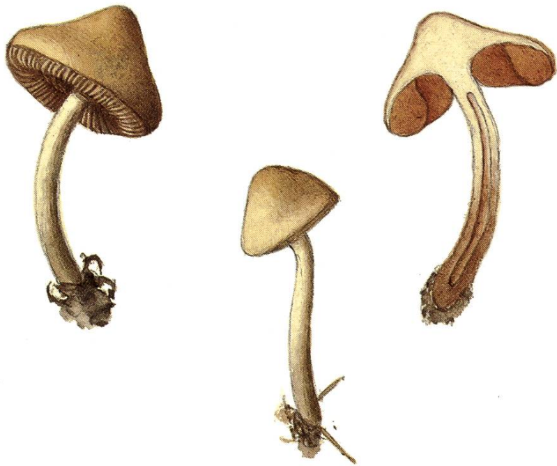
Hebeloma magnimamma (Fr.) Quel.