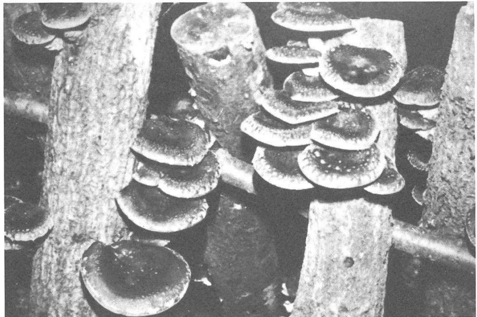
Shiitake-Pilz auf Holz